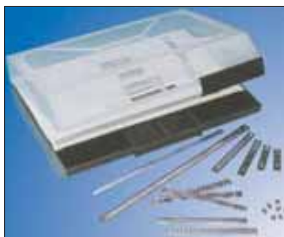
SS Kit L inneholder skinner, merker og stålband.

SS Kit L inneholder 1 remse a 20 SSM merker A-Z, 0-9, jord og umerket, 10 skinner SSC, 46mm, 56mm, 82mm, 106mm; samt 100 endestoppere og 20 stålband MBT.