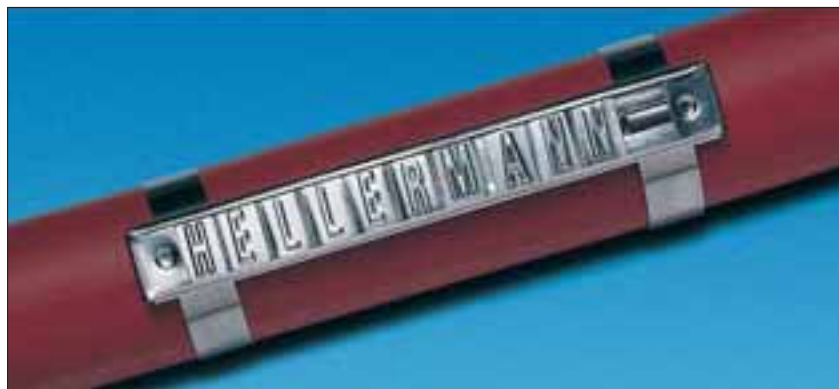
Merkesystem Hellermark SSC skinne med merker SSM, festet med stålband type MBT.

Skyv ønsket merke inn i den rustfrie stål-skinnen (SSC-serien) og lås med en endestopper (SSCP), alternativt kan skinnen enkelt klemmes sammen i endene med en tang. Den ferdige merkingen festes deretter til rør eller kabel med MBT stålband.